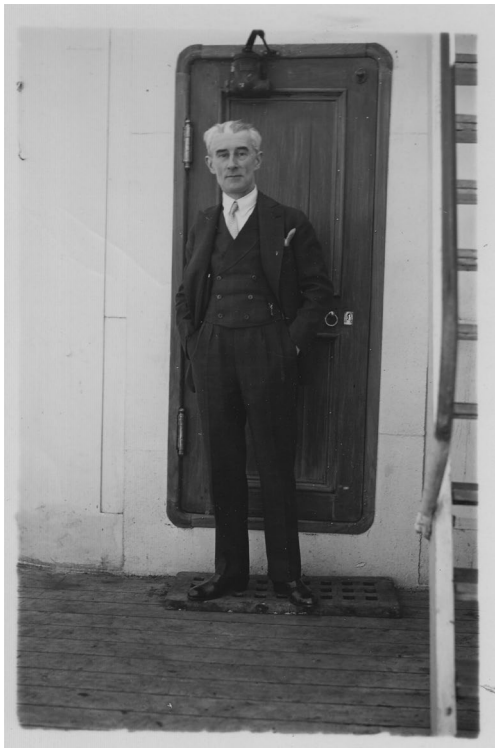
Maurice Ravel in April 1928, returning from New York to Le Havre